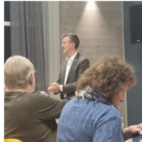
Øverst: Per Martin Sandtrøen Nederst: Kommunal- og distriktsminister Erling Sande